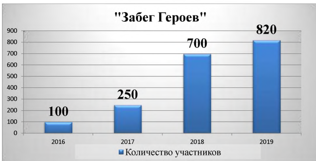
Рис. 3. Динамика увеличения участников в физкультурно-спортивных соревнованиях